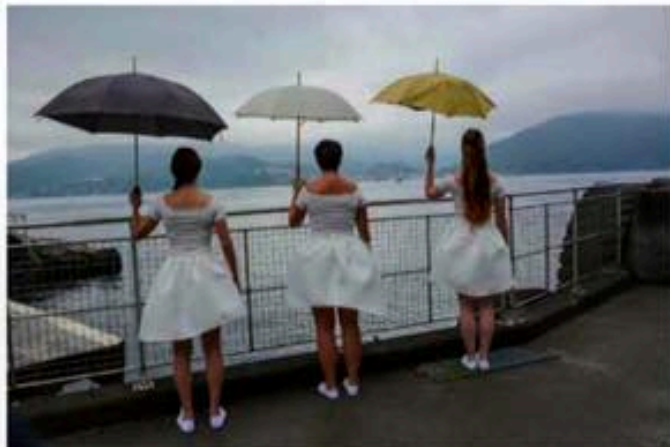
Delar av fråmøyninga skjer utandørs.

– Utfordringa vår har vore å utforska rommet og gi det ei ny mening, smiler ho og seier at publikum må også denne gongen rekna med å bevega litt på seg. Ein skal vandra litt rundt, og det som skal skje, foregår både ute og inne. Så mykje meir vil ho ikkje røpa. Publikum får bli overraska når dei kjem. Så kom ferja, ventetida var slutt, kunstnarane vinkar farvel og håper at suldølen har lyst å venta til helga.